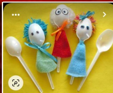
Театр из ложек