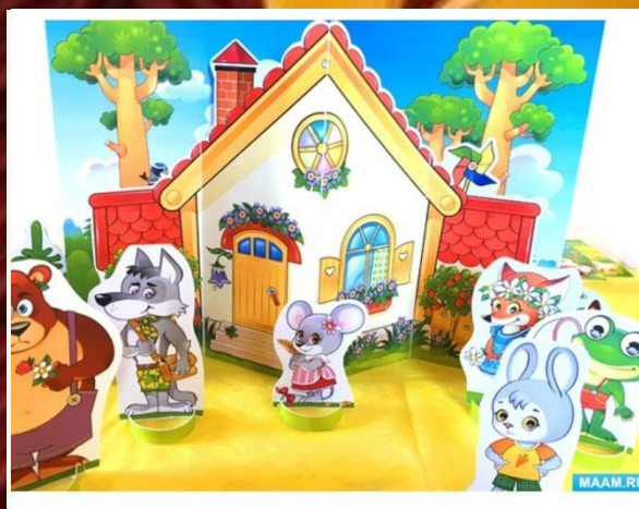
Театр на прищепках