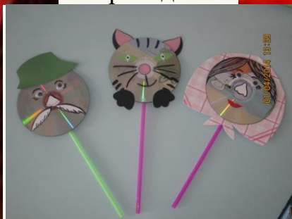
Театр на дисках