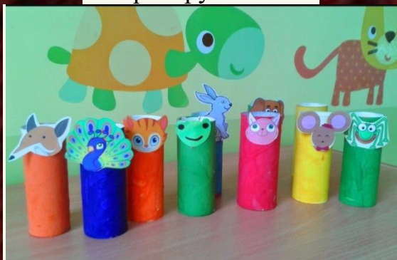
Театр из рулончиков