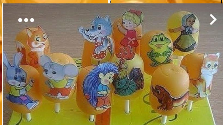
Театр на палочках